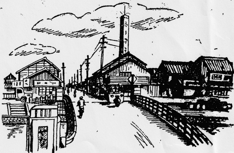
柳原橋からみた中川区柳堀町一図案業、岡田国彦氏画